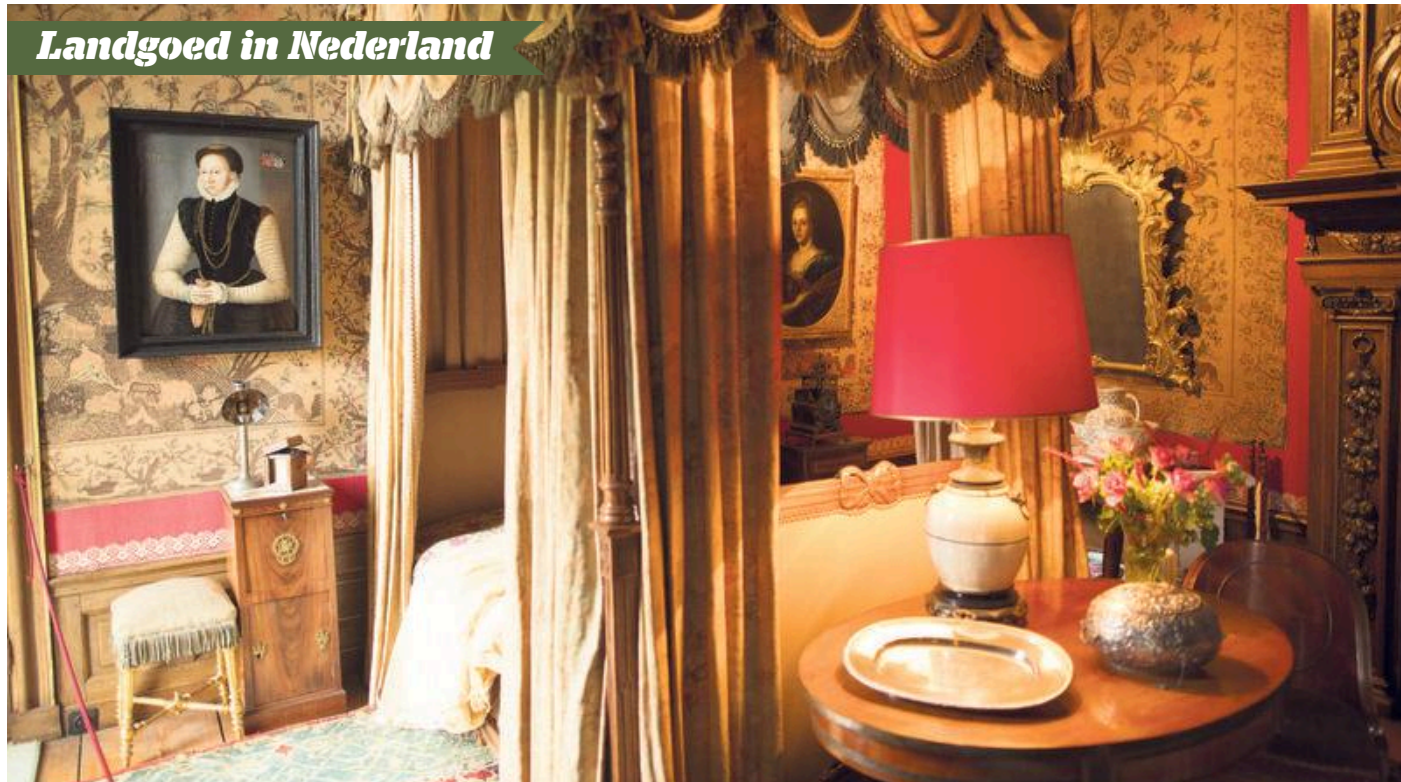
Een hemelbed, voornaam meubilair en oude familieportretten op landgoed Duivenvoorde.